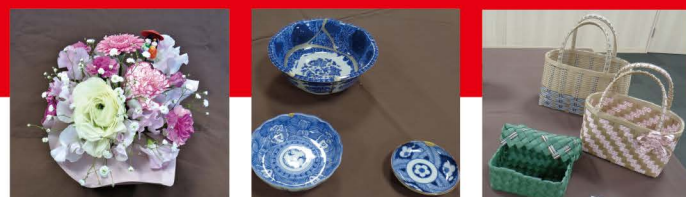
フラワーアレンジメント講座