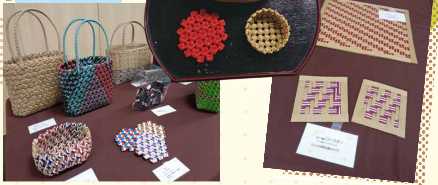
※写真はあくまでもイメージです。